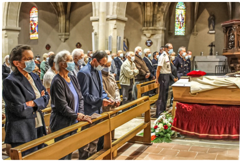
Au premier plan, la famille