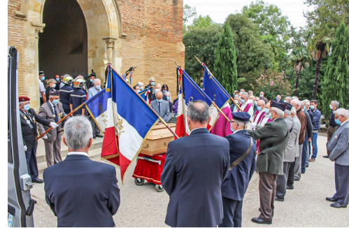
Hommage des drapeaux