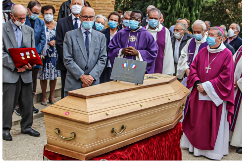
Bénédictio avec les Anciens combattants (« À notre camarade »)