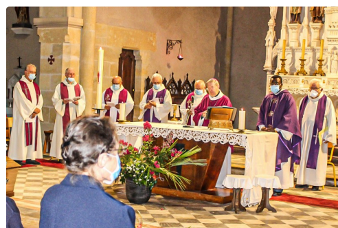
Les concélébrants autour de l'archevêque