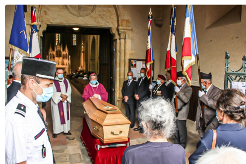
Accueil du cercueil à l'église