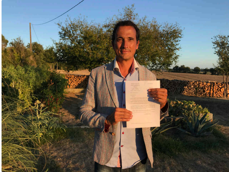
Vivre en harmonie à Saint-Cricq ? Pas si évident !

Deux listes s'opposaient aux municipales. Une requête en annulation est jugée recevable par le tribunal administratif de Pau. Décision à venir bientôt.