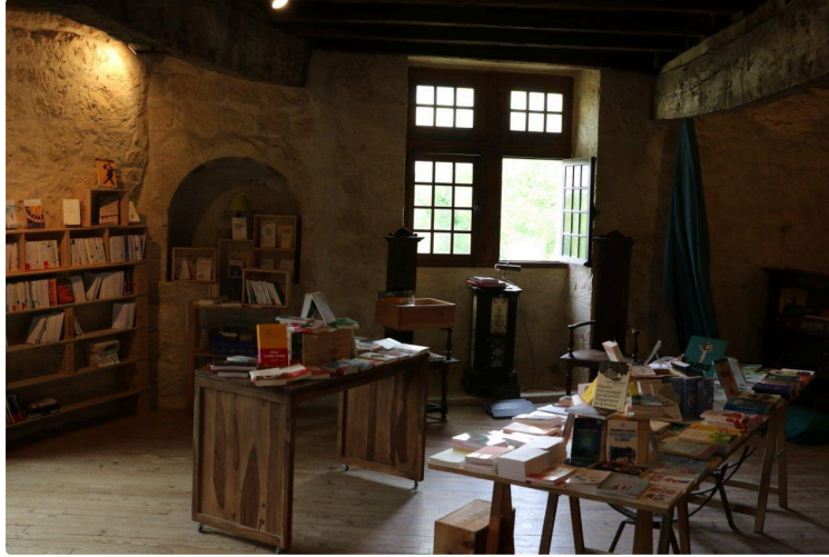
Rencontre avec un « désobéisseur »

En fait, l'auteur d'un véritable livre d'obéissance... à l'essentiel