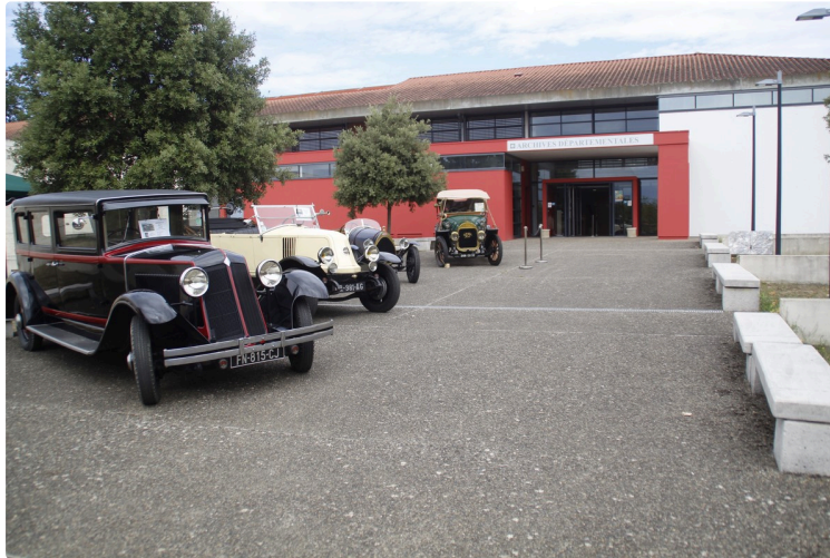
Visite des Archives départementales