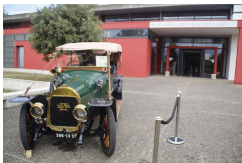
Voiture Bozier Type 13 Brescia

Laissons à Pascal Geneste le mot de conclusion de cette manifestation : « En pleine crise sanitaire et malgré les contraintes que cette dernière impose (inscriptions préalables, gestes-barrières et surtout limitation des groupes), je crois qu'on peut se réjouir d'avoir obtenu ce chiffre-là ! »