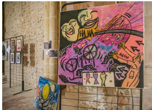
Gros plan sur le tableau de gauche de la photo ci-dessus