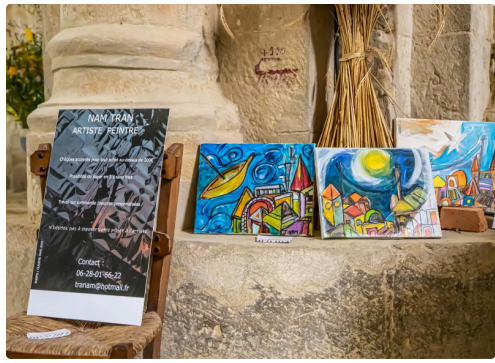
Petits tableaux pas chers