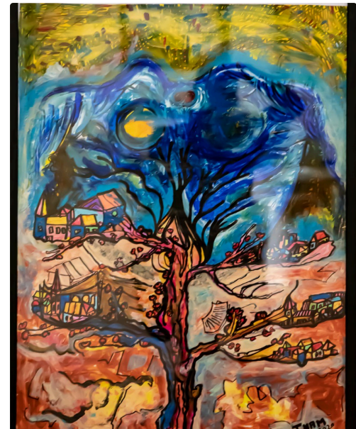
1 Tableau de Nam Tran 1bis 180920.jpg