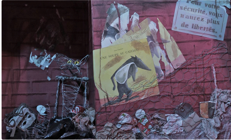
Un moment à partager

Dans le cadre du festival Dire et Lire à l'Air la Médiathèque Départementale du Gers propose "Matin Brun". Un entresort théâtral en caravane joué par la Compagnie Le Fond de l'eau.