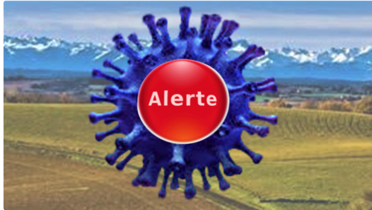
Gers Covid-19, la cote d'alerte