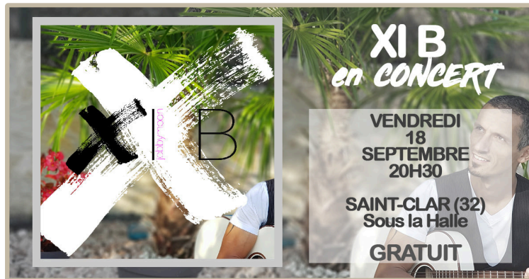
La fête locale déplacée à cette mi-septembre

La mairie de Saint-Clar organise la fête locale du 18 au 20 septembre.