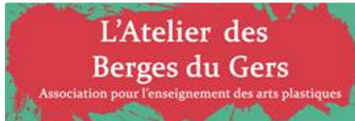
Vernissage « Expo élèves adultes ABG 2020 »

Très beau vernissage de l'exposition des « Artistes* de l'ABG » le vendredi 11 septembre à 18h dans les locaux du 5 chemin du moulin de la Ribère à Auch.