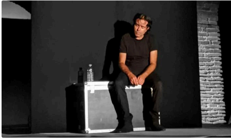
Reprendre possession du théâtre pour assouvir sa soif de culture

... et découvrir une programmation riche et variée