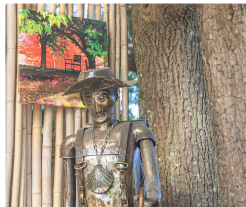
Photo sur toile de Claire Teissier-Godart et statue de pèlerin de Bernard Ravagnani