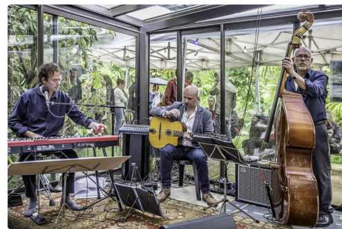
Pause du Myosotis Trio entre 2 chansons en juin 2017 à la Palmeraie