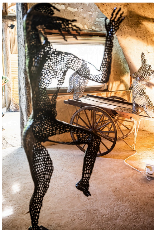
Sculptures métalliques de Denis Fourez