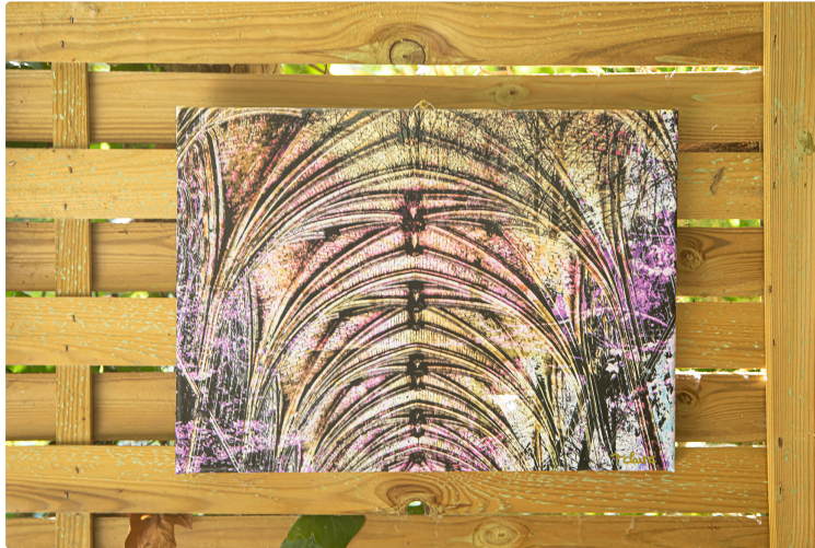
Journée exceptionnelle à la Palmeraie de Bétous

Pour son 40e anniversaire : concert Brassens, photos sur toile et sculptures en métal