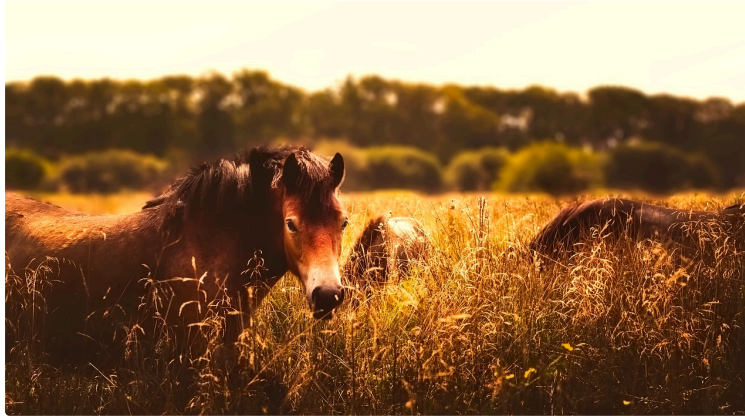
Chevaux mutilés : le Gers bientôt touché ?

Après la découverte d'un lama mort suite à des mutilations dans le Lot et Garonne, département limitrophe du Gers, la population se mobilise via les réseaux sociaux.