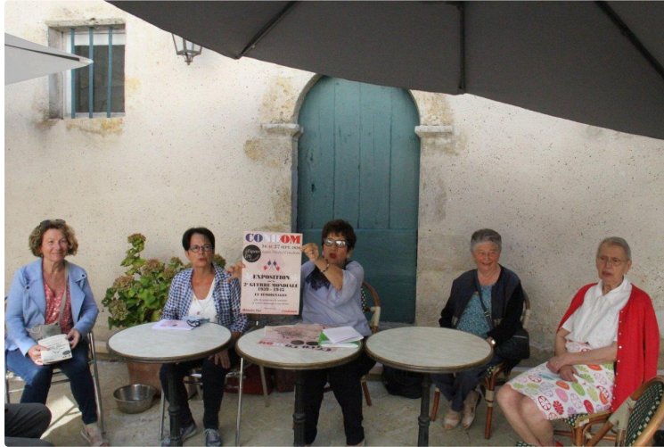
Condom et le Gers au temps de la Seconde Guerre mondiale

Nouvelle exposition à l'église Saint-Michel