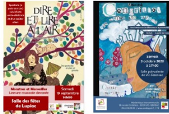
Médiathèque : une riche actualité en cette rentrée

Après 15 jours de vacances, la médiathèque a rouvert ses portes le mardi 25 août.