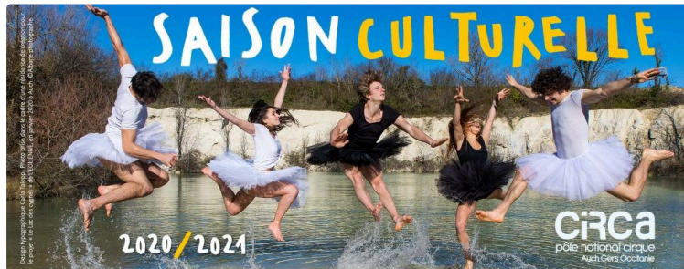
CIRCa fait sa rentrée

Après l'interruption des spectacles en raison de la crise sanitaire, les organisateurs ont présenté la nouvelle saison culturelle. Entre retrouvailles et découvertes.