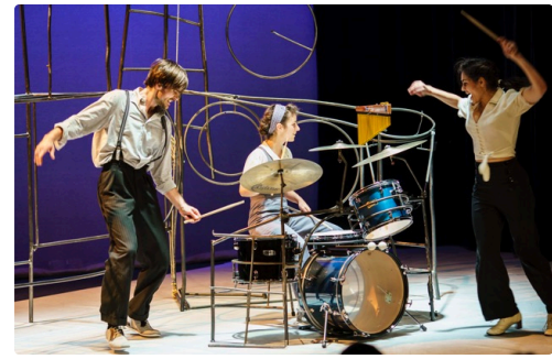
Lumière ! So Jazz - Photo Pierre Ricci