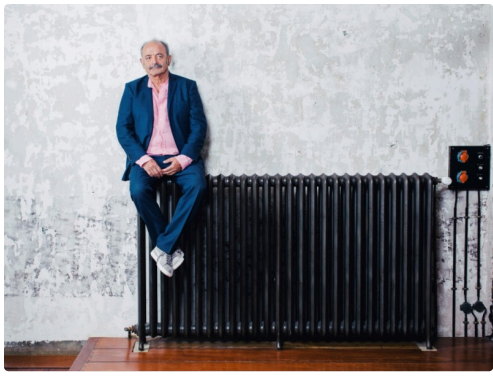
Louis Chedid