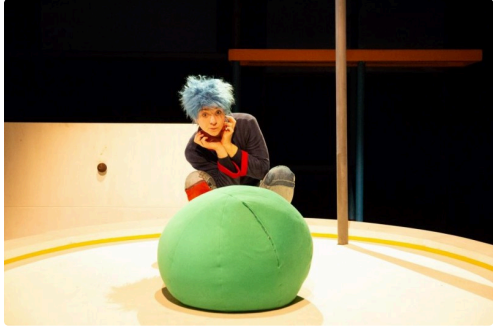
Est-ce que je peux sortir de table