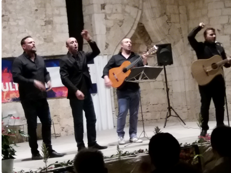
Un voyage lumineux et coloré par les chants et guitares corses