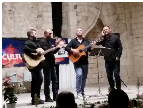
Concert 2020 ACLED Chants Corses 5.jpg