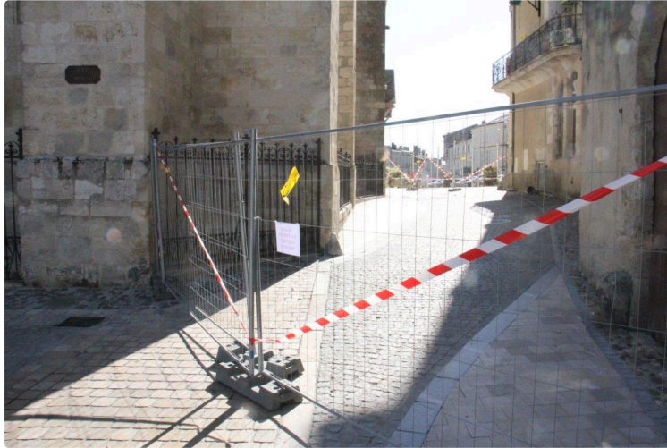
La dégringolade ... des pierres !