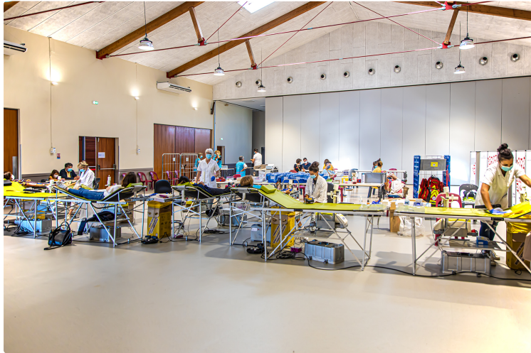
Don du sang dans le calme et la sérénité à Nogaro

Lundi 31 août, l'organisation de la collecte de sang a fait un progrès majeur. L'association Don du sang à Nogaro et Aignan a pu obtenir de l'Établissement français du sang (EFS) que le créneau consacré à la collecte de sang à Nogaro ce lundi soit élargi : il s'est ouvert de 11 h 30 à 18 h 30 au lieu de 13 h 30 à 18 h 30), ce qui a permis aux donateurs bénévoles qui travaillent de venir pendant leur pause déjeuner.