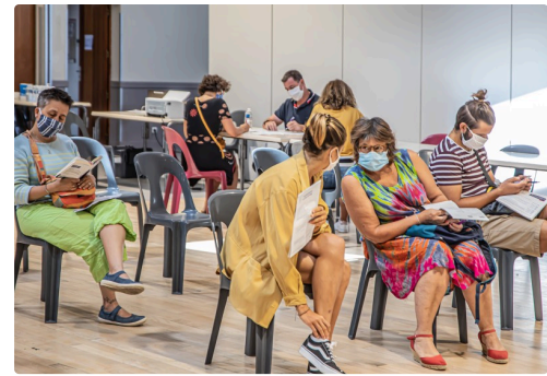
Ceux qui attendent leur tour