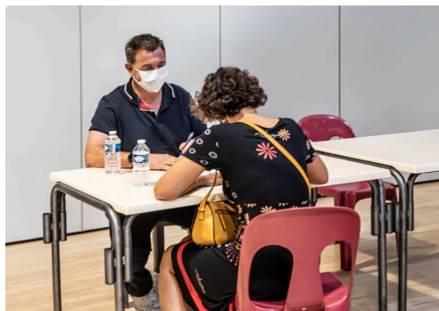
Réponse au questionnaire...

Sont pratiquées : des transfusions de plasma, des transfusions de concentrés de globules rouges et des transfusions de concentrés de plaquettes.