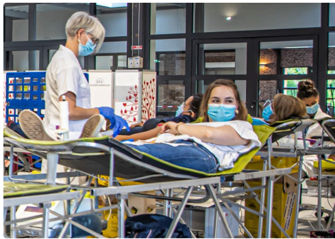
Gros plan sur un prélèvement