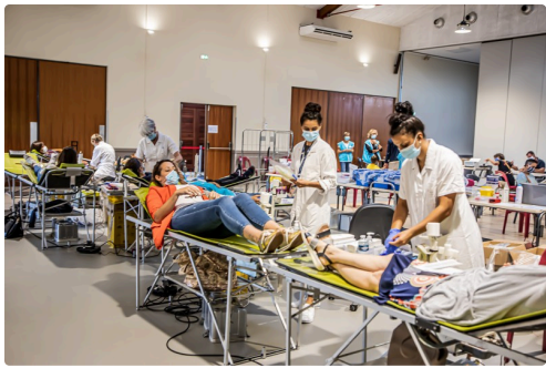
Vue générale des prélèvements en cours