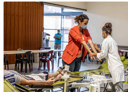
Le prélèvement peut commencer