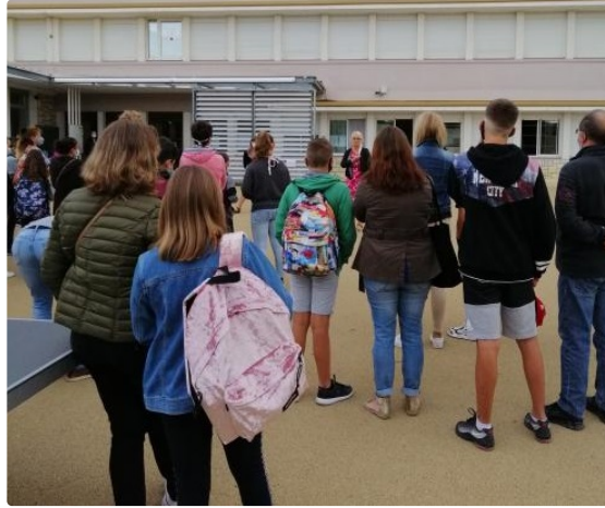
Rentrée masquée des sixièmes au collège Gabriel Séailles

C'est sous une météo de rentrée - fraîcheur de mise - que les nouveaux venus au collège Gabriel Séailles, les élèves de sixième, faisaient leur rentrée ce mardi matin à 9 h .