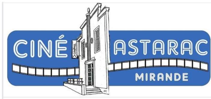
Cinéma de l'Astarac, c'est la reprise

Pour cette première quinzaine de septembre, le cinéma de l'Astarac à Mirande vous propose trois séances par semaines : Le Mercredi, Vendredi et Samedi soir.