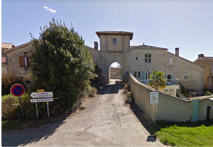
Castelnaux ou castelnaus ?

Allez, le choix est fait, ce sera castelnaux !