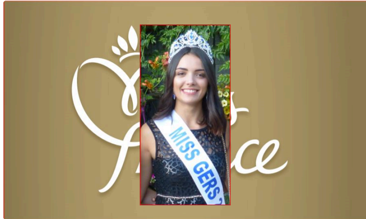
Miss Gers 2020

Elles seront huit à candidater pour succéder à Andréa Magalhaes au titre de Miss Gers 2020. Le rendez-vous est fixé demain, dimanche 30 août, à Castéra-Verduzan, bien sûr comme toujours, pas au parc Lannelongue comme prévu Covid-19 oblige, mais retour dans la salle polyvalente, météo oblige en premier. Pas de problème, car les gestes barrières seront respectés, l'horaire lui est inchangé, c'est bien à 16 h 30.