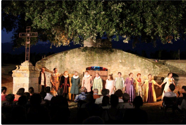
Le festival Théâtre en Pays de Gascogne 2020

La Compagnie La Boîte à Jouer satisfaite du bilan de cet été malgré les conditions imposées par le Coronavirus