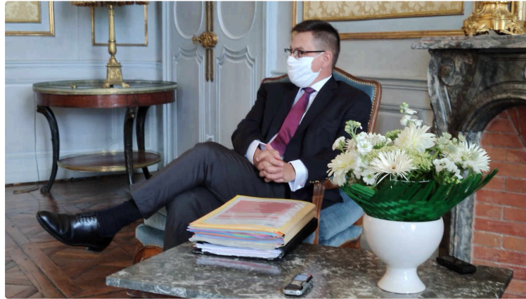
Rencontre avec le nouveau préfet du Gers