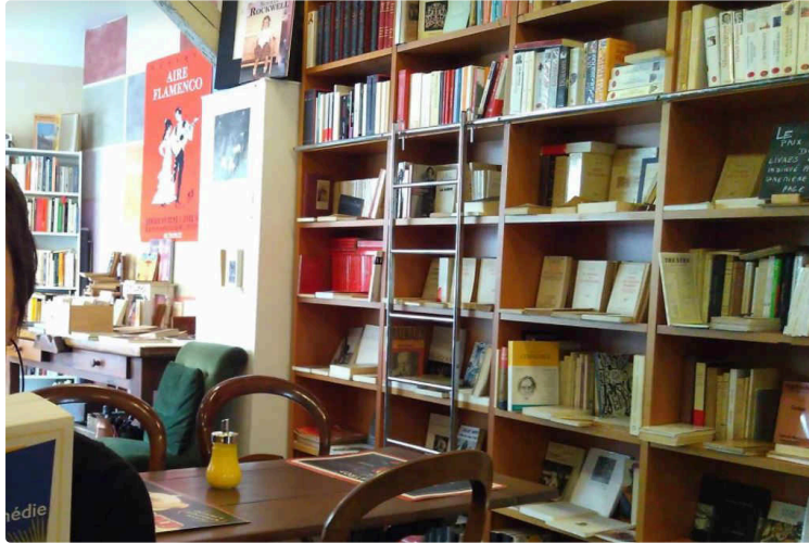
Préparez vos futures soirées d'hiver au coin du feu !

Allez à Jegun dénicher de quoi faire vagabonder votre imagination, grâce aux bouquinistes présents à la nouvelle Foire aux livres !