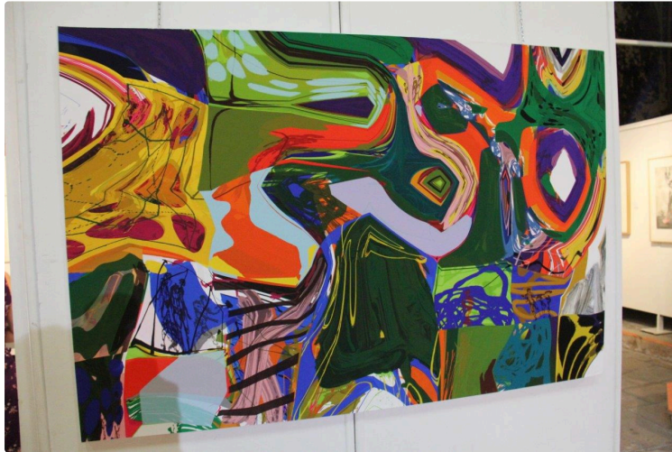
L'estampe, une œuvre de création qui peut être très colorée

Découvrez les artistes de l'association Estampadura dans l'église Saint-Michel !