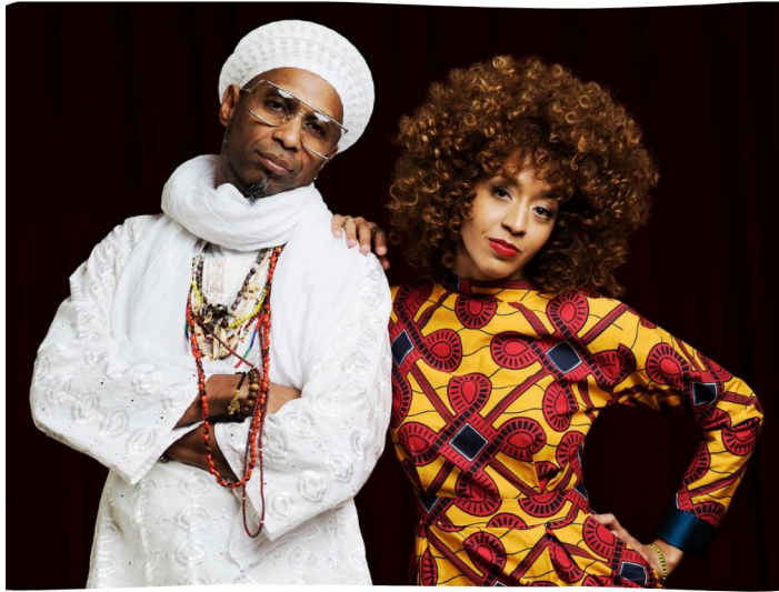
Le Jazz retrouve les arènes