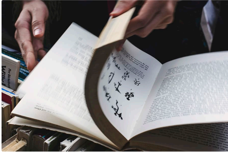
Une journée pour flâner au milieu des bouquins !

Un détour par Jegun pour profiter d'une foire aux livres