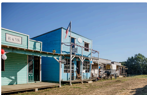
Suite de la rue