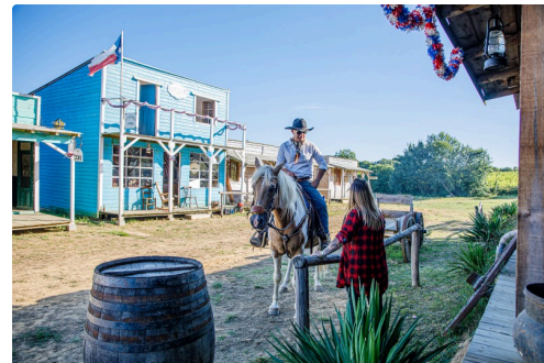
La vie quotidienne à Carchet City