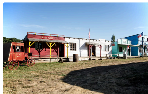
Un côté de la rue à Carchet City