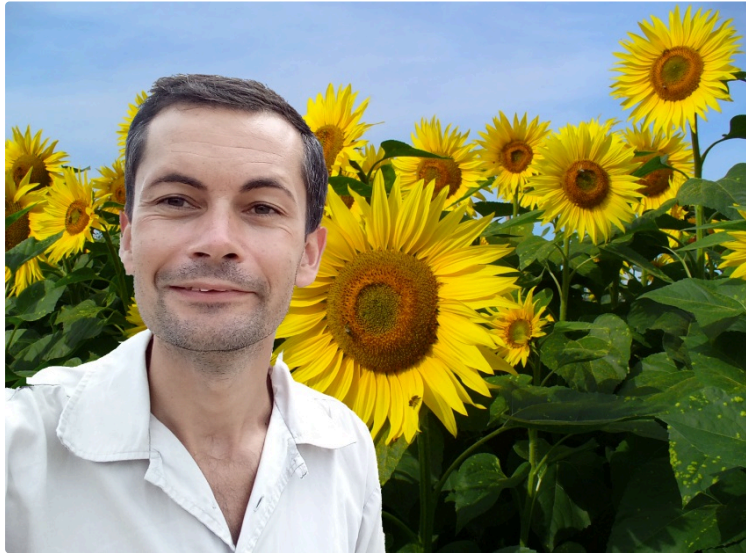
La fabuleuse histoire du Tournesol du Gers

Le Gers offre parmi les plus beaux paysages de tournesols. Retour sur une histoire de plusieurs siècles, entre Amériques et Asie.