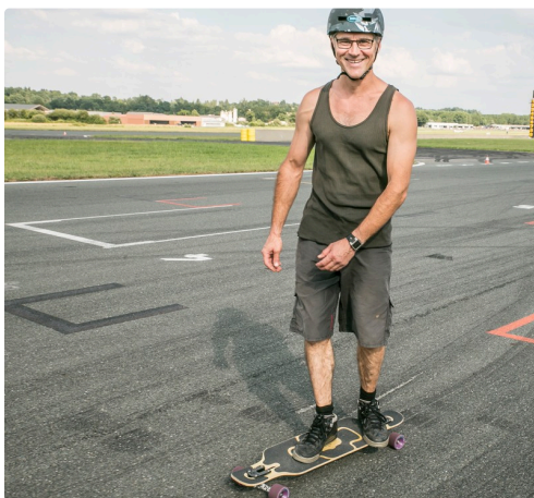
1 skateur 1ter 250614.jpg

Le créneau 20 h 30 – 21 h 30 sera réservé aux vélos de course.