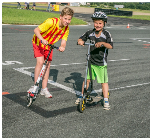
2 patinettes 1ter 250614.jpg