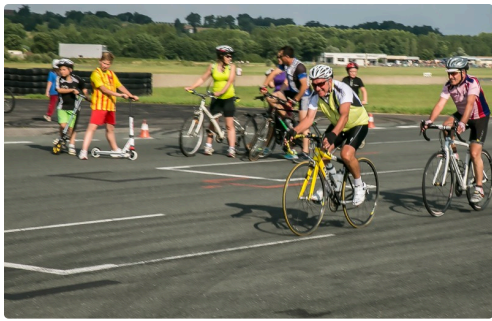
La piste se meuble 1er 250614.jpg