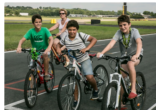
3 ados 1ter 250614.jpg