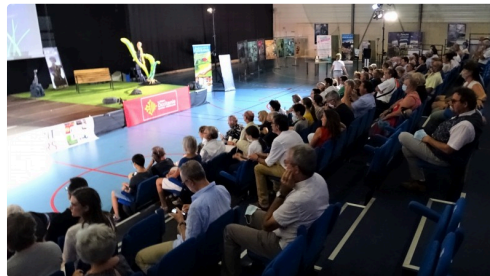
Le public de fidèles était là même limité compte tenu de la situation.