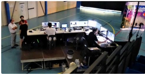
Un plateau technique comme ça ne s'improvise pas.

https://www.festival-astronomie.com/nous-soutenir .