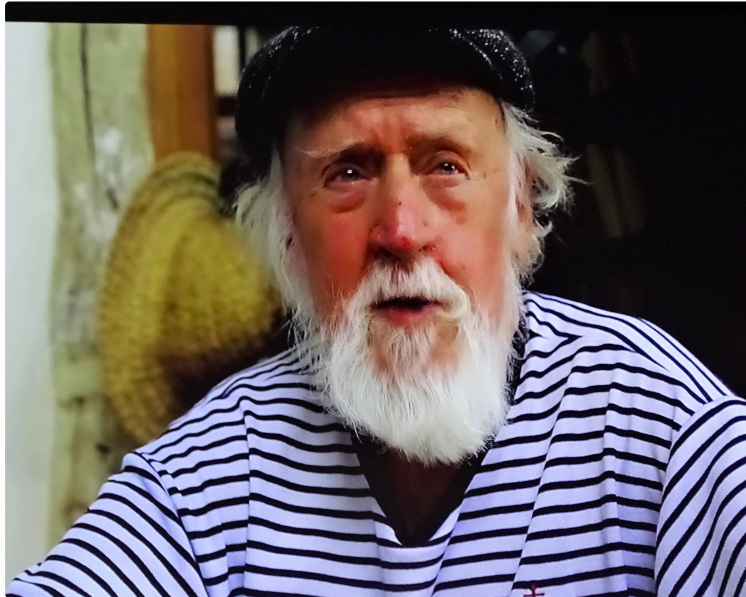
Un festival d'étoiles