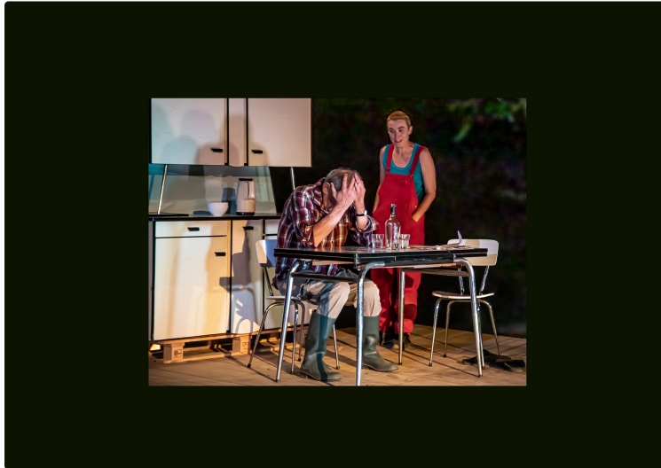
Encore deux spectacles des "Moissons d'été", ce samedi

Ci-dessous, photos des spectacles du vendredi 7 août