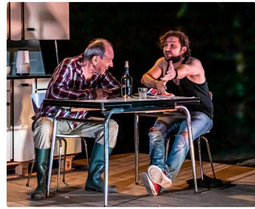
Boire un bon coup avec le voisin réfugié bosniaque