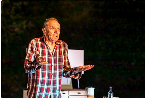
Retour du père sur sa vie consacrée à ses vaches