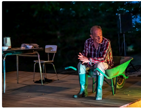
Tristesse du père : il est seul et son métier est décrié