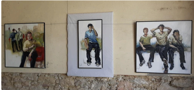
Idée de sortie pour ce week-end : art à Roques

La chaleur de ce vendredi n'a pas effrayé le public qui est venu en nombre assister au vernissage de l'exposition de peinture - photo - sculpture dans le petit village de Roques.