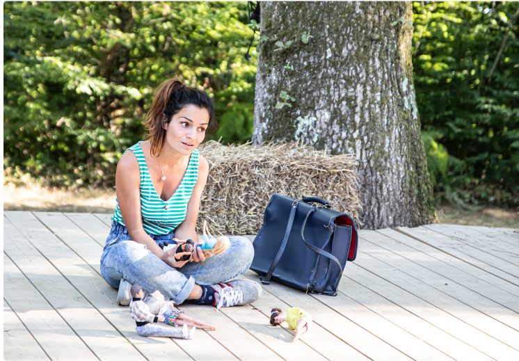
Festival Moissons d'été - derniers jours

Encore 2 spectacles vendredi 7 + 2 samedi 8 août