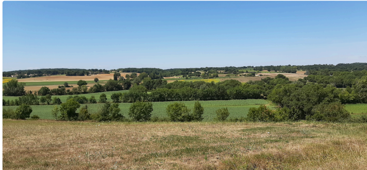
Rappel : la balade de la semaine à Mourède

Cette semaine, la balade que nous vous proposons est celle qu'organise, chaque été, l'Office de Tourisme.