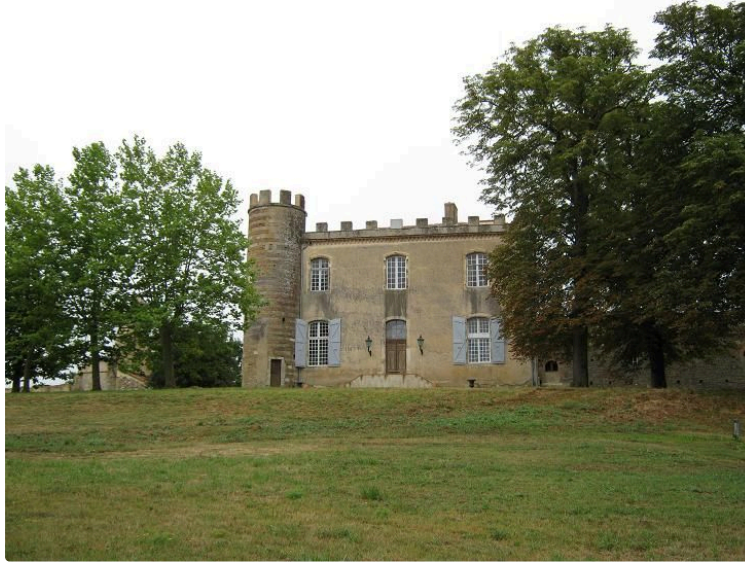
Beethoven le premier romantique

Après-midi de concerts à l'occasion du 250e anniversaire de la naissance du compositeur