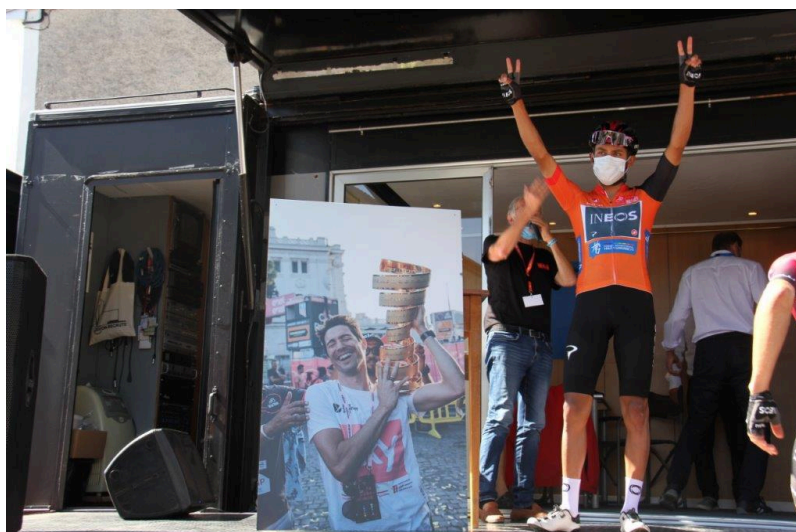
Pas de surprise, Egan Bernal, le vainqueur du dernier Tour de France qui s'adjuge l'édition 2020 de La Route d'Occitanie. Thibaut Pinot conserve sa 4e place au général.

Egan Bernal, ce mardi matin, avant le départ de l'étape, sur le podium, avec le portrait de Nicolas Portal.