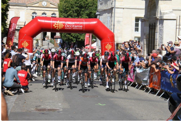
Route d'Occitanie - Comme prévu, le départ a été donné devant l'hôtel des Doctrinaires

Avant le coup de sifflet libérant les coureurs, hommage de tout le peloton, avec des applaudissements nourris, en souvenir de Nicolas Portal