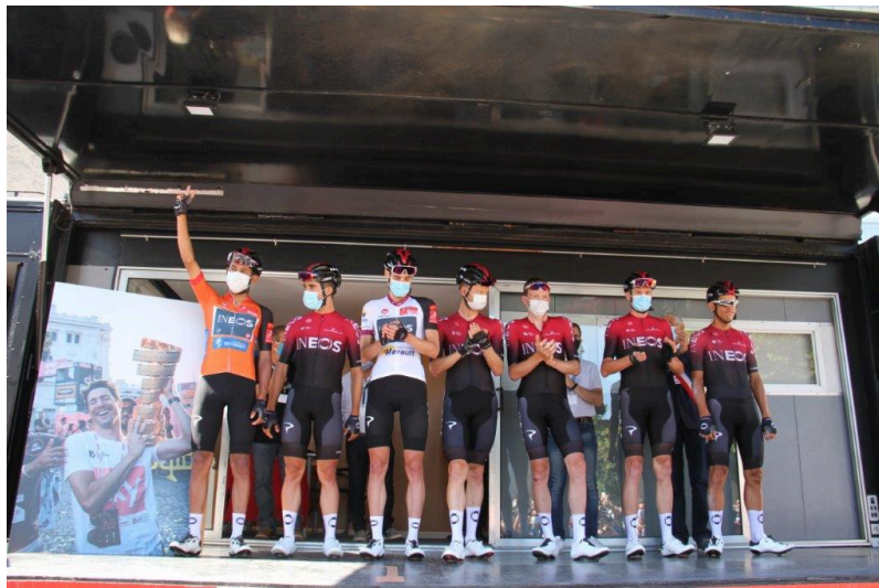
Le Team Ineos avec le leader de l'épreuve, Egan Bernal, mais également avec Christopher Froome, ancien vainqueur du Tour de France.