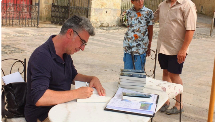
"Amoureuses" de Frédéric Baptiste sera-t-il élu Roman Version Femina 2020 ?

Cette première œuvre, inspirée d'une histoire vraie, une bonne lecture pour l'été !