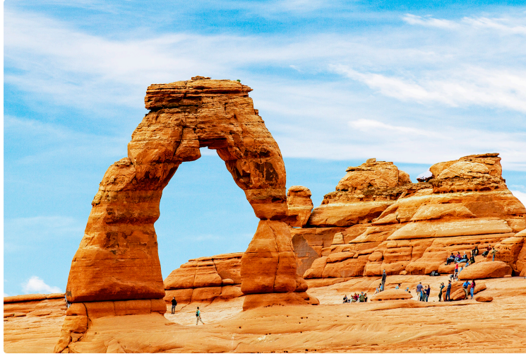
L'Ouest américain vu par Gilles Nicoud

Des vues époustouflantes éclairées par le regard d'un passionné de l'instantané. Des "morceaux de bijoux photographiques" sont devant les yeux, une vision personnelle de l'auteur qui nous offre un beau voyage à travers l'ouest américain. L'univers qu'il propose, nous transporte dans des paysages des meilleurs westerns anthologiques, des souvenirs inoubliables pour l'amateur du genre.