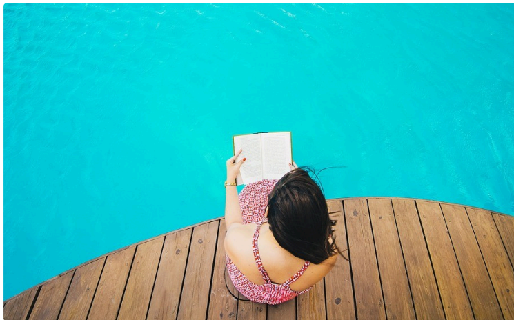
À vos marque-pages !

Chaque premier samedi du mois, le Journal du Gers vous propose une balade chez les libraires et vous révèle leurs coups de cœur du moment.