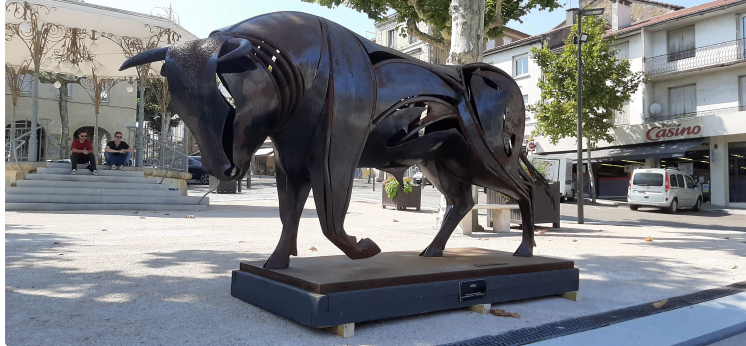
Urus veille sur Vic !