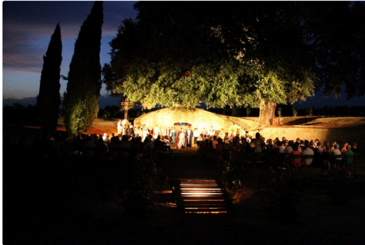
Pas d'orage, hier soir, fort heureusement !

Si les deux jeudis prochains ressemblent à ce 30 juillet, les comédiens de La Boîte à Jouer devraient s'estimer satisfaits.