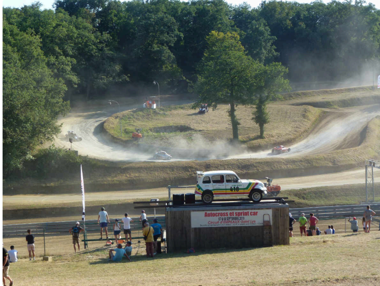
Pas de nocturne pour l'Autocross, cette année

Mais un concert gratuit et toujours autant d'engagés pour attirer les spectateurs, à Tournecoupe