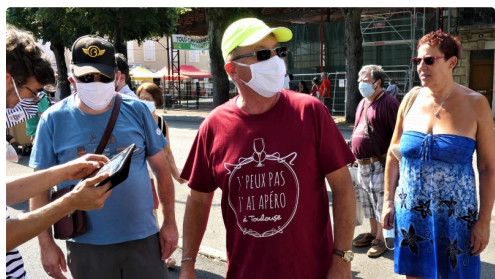
et l'apéro dans le Gers ?