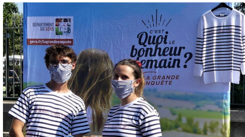
les jeunes étudiants