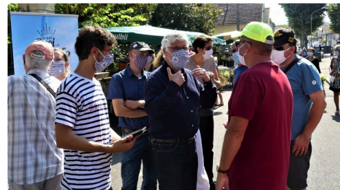
on discute, on propose