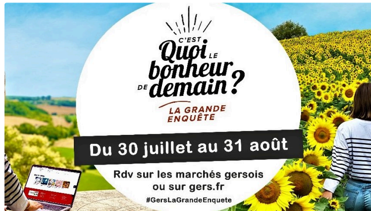
C'est quoi le bonheur de demain ? La Grande Enquête

Le Conseil départemental lance une grande enquête participative sur le thème du bonheur et de la qualité de vie dans le Gers intitulée « C'est quoi le bonheur de demain ? La Grande Enquête ». Ce projet doit être resitué dans un double contexte : la crise de la COVID19 qui n'est pas terminée et les 25 ans du film d'Étienne Châtelier, « le bonheur est dans le pré ».