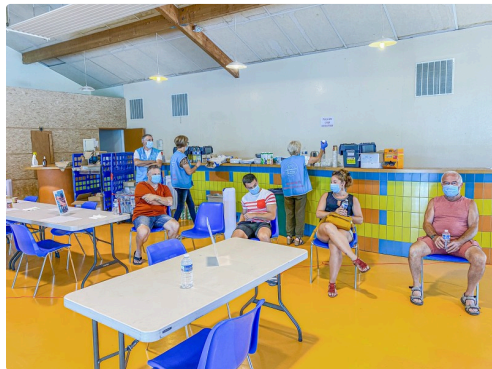
Les donateurs attendent leur tour assis ; les membres de DSNA sont en bleu