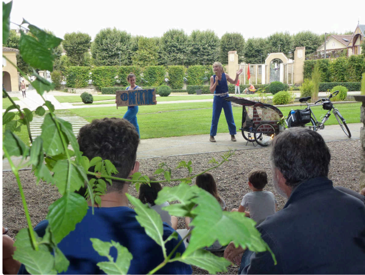
Lo et Ly témoignent du No(s) Futur(s)

Un duo comique et apocalyptique qui a fait halte au Jardin Ortholan