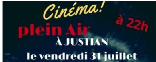
Vendredi 31 juillet à Justian : randonnée, marché et cinéma en plein air !