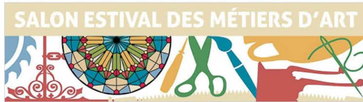
Balade dans le clos parmi les artisans d'art

Balade dans le clos parmi les artisans d'art - rue de l'évêché.