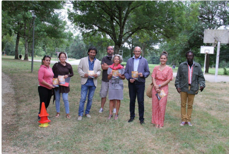
Condomois de tous âges, venez découvrir la base de loisirs de Gauge !

Rejoignez-y les jeunes enfants et les adolescents qui y ont déjà leurs habitudes